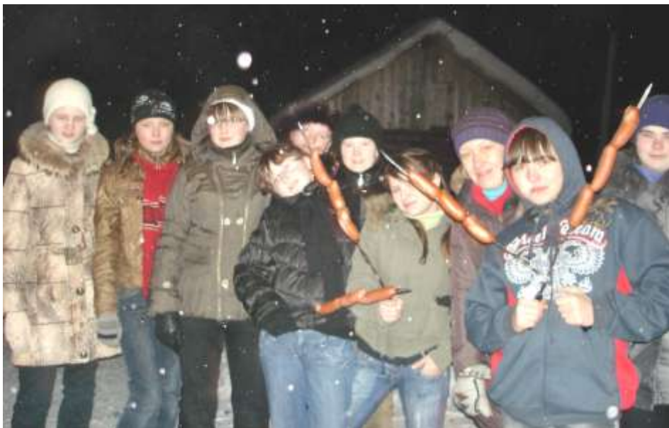
Сосисок и нам мало!

Поздравляем лицеистов с успешным выступлением в Санкт-Петербургской открытой олимпиаде школьников по химии