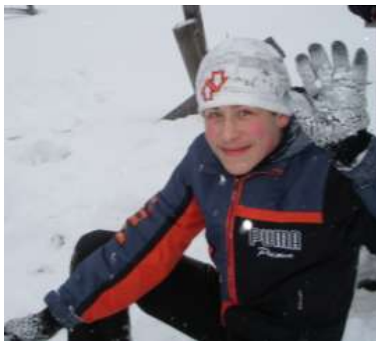
Паша — радость наша