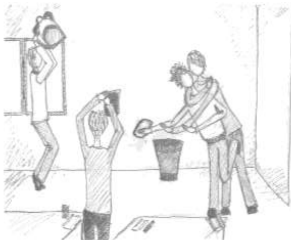
Вот так и летит все в корзину. Не свое, чужое летит.

Такие «веселые старты» могут случаться каждую перемену. Все игры сопровождаются обезьяньими «у-у-а» и другими звуками природы. За