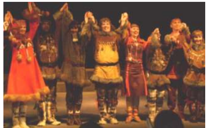
Актеры театра принимают благодарственные аплодисменты зрителей