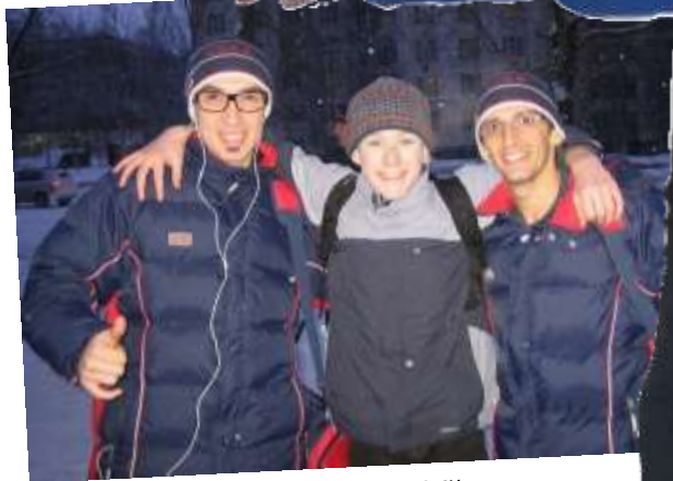
Слава с бразильцами

они не знают ни русского, ни английского языка, а в ответ на наше «one photo please», лишь мило улыбались и махали головой. Тут нам на помощь пришел переводчик команды, и футболисты любезно согласились сфотографироваться. Бразильцы широко улыбались и, мне кажется, искренне радовались.