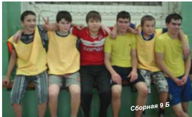
Сборная 9 Б