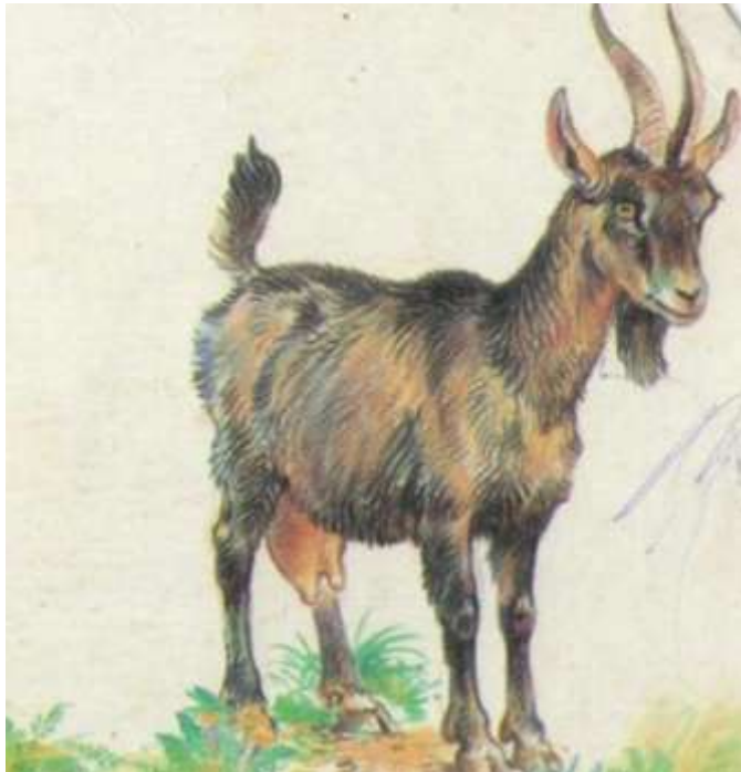
Таких в лицее не наблюдается?

Совсем недавно в лицее праздновались 23 февраля и 8 марта. Посмотришь на сцену – душа радуется! Все классы дружные, сплоченные... Все-то друг друга любят, все-то друг друга уважают. А что в реальной жизни?