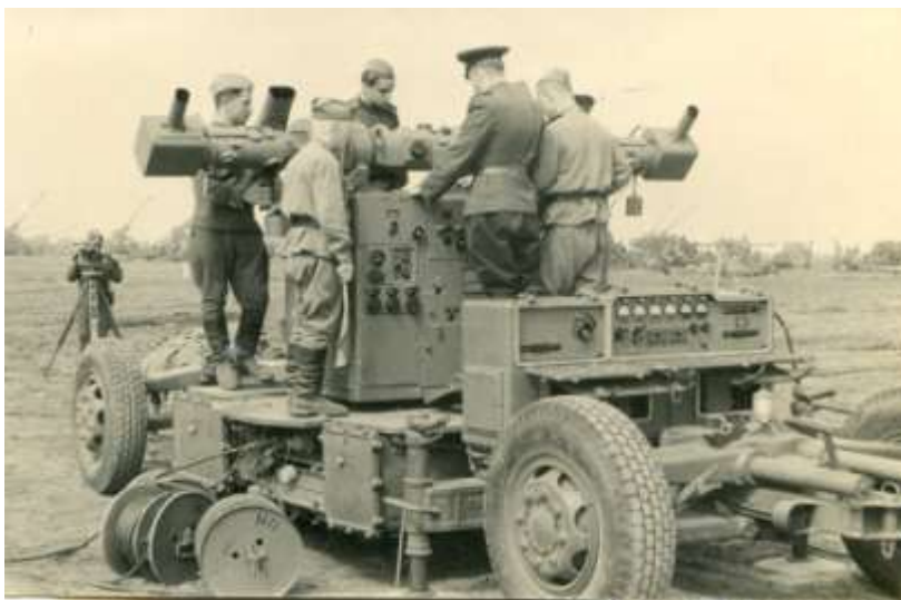
Служба в ГДР

- После семилетки учился в техникуме. Учился хорошо, получал повышенную стипендию на третьем и четвертом курсах за отличные оценки. На первом и втором получал 140 рублей и 160 рублей соответствен-